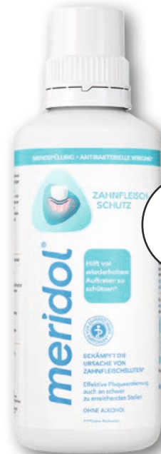
meridol® Mundspülung 400 ml 1 l = € 17,45