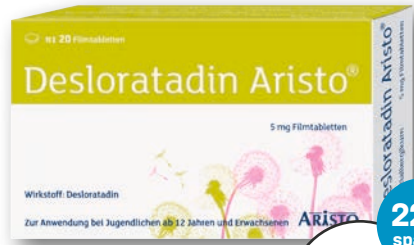
Desloratadin Aristo® 5 mg Filmtabletten 20 Stück