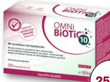
OMNI BIOTIC® 10 20 Portionsbeutel à 5 g 1 kg = € 259,80