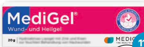
MediGel® Wund- und Heilgel 20 g 1 kg = € 349,00