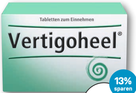
Vertigoheel® 100 Tabletten