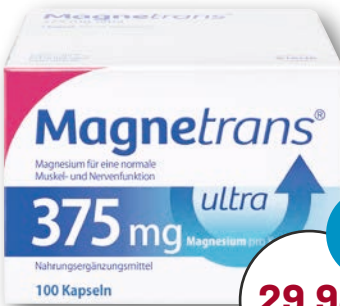
Magnetrans® ultra 375 mg 100 Kapseln