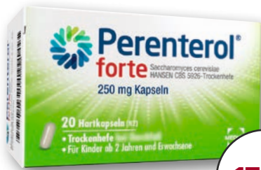
Perenterol® forte 250 mg Kapseln 20 Hartkapseln