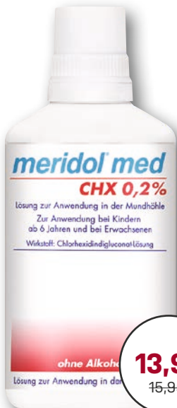
meridol® med CHX 0,2% Lösung 300 ml 1 l = € 46,60