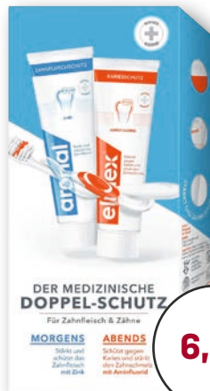
aronal® / elmex® Doppelschutz- zahnpaste 2 x 75 ml 1 l = € 46,53