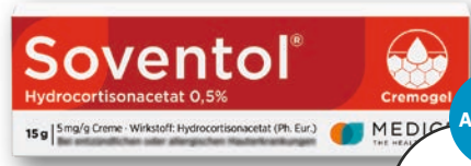
Soventol® Hydrocortisonacetat 0,5% 15 g 1 kg = € 598,67