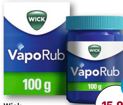
Wick VapoRub Erkältungssalbe 100 g 1 kg = € 159,80