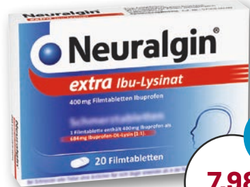
Neuralgin® extra Ibu-Lysinat 684 mg 20 Filmtabletten