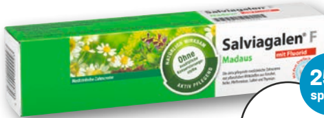
Salviagalen® F Madaus Zahncreme mit Fluorid, 75 ml 1 l = € 46,40